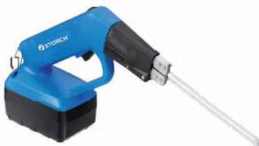
obj. č. 43 61 20