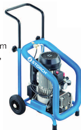
obj. č. 64 45 00