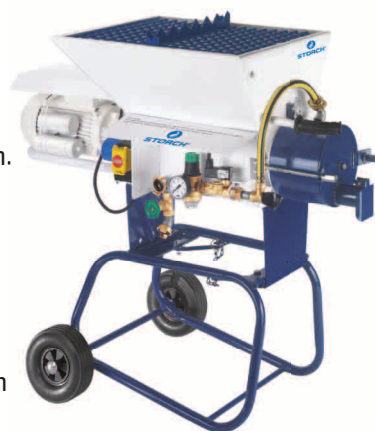
obj. č. 64 35 00