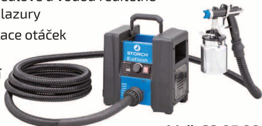
obj. č. 68 05 00