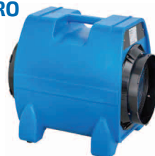
obj. č. 61 45 50