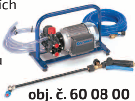
obj. č. 60 08 00