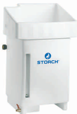
obj. č. 61 20 00