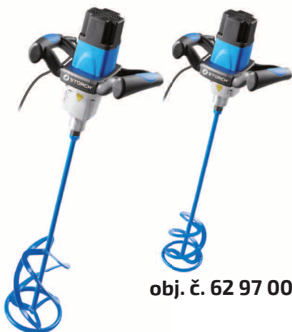
obj. č. 62 98 00 a 62 99 50