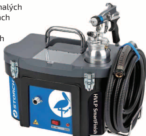
obj. č. 68 42 00