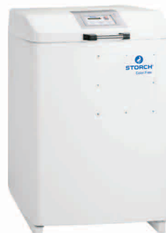
obj. č. 61 30 00