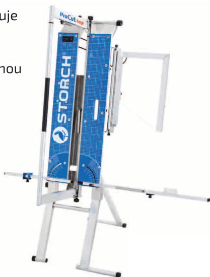
obj. č. 57 00 35