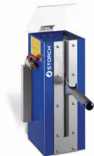
obj. č. 61 20 50