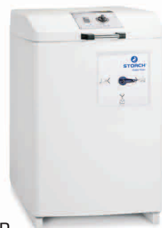
obj. č. 61 30 30