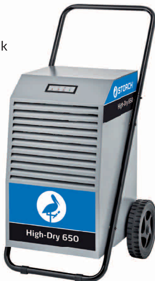
obj. č. 61 55 00