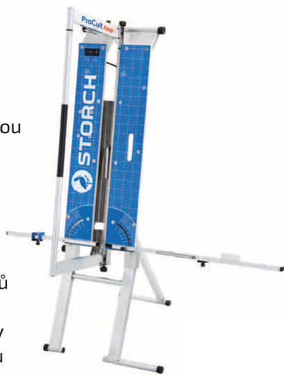
obj. č. 57 00 30