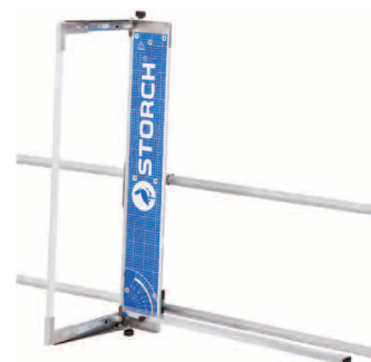
obj. č. 57 00 70