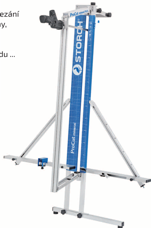
obj. č. 57 01 90