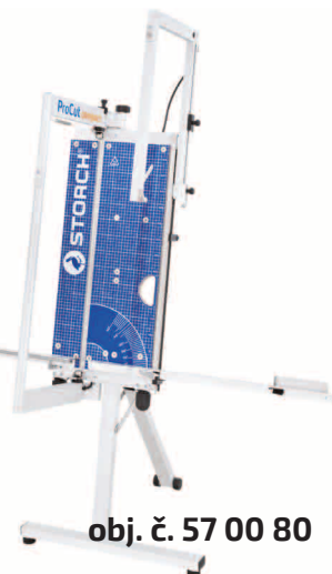
obj. č. 57 00 80