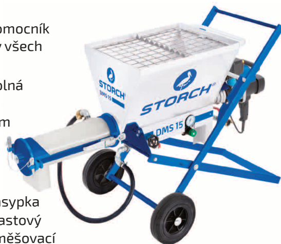
obj. č. 64 34 00