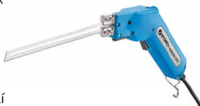
obj. č. 43 61 50