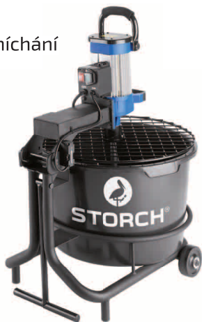
obj. č. 64 55 00